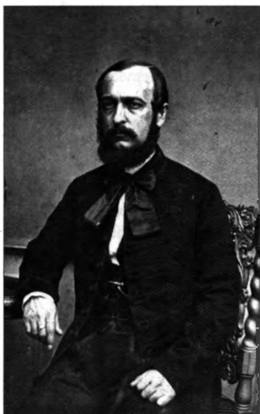
Csengery Antal 1861-ben, ismeretlen fotográfus fényképe (Magyar Nemzeti Múzeum, Történeti Fényképtár)

Amikor Ferenc József belátta, hogy az országgyűlési többség nem fogja támogatni a bevezetni kívánt alkotmányos konstrukciót, feloszlatta az országgyűlést. Csengery ezek után ismét visszatért az újságíráshoz. Számára az a fajta passzivitás, amelyet Deák ekkor választott, nem volt követhető már egzisztenciális okokból sem. 1862 elejétől nap mint nap jelentkezett a Pesti Napló címlapján új, Bécsi dolgok című rovatával. Miközben a birodalom fővárosában megjelent lapokat szemlélte, hozzáfűzéseiben, rövid megjegyzéseiben,