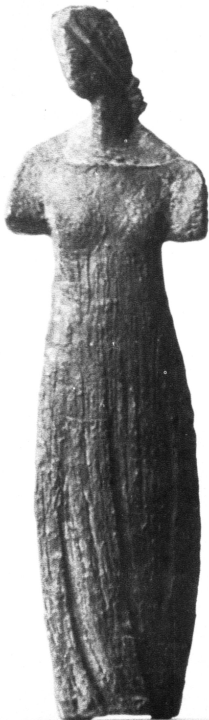
Női alak, 1962