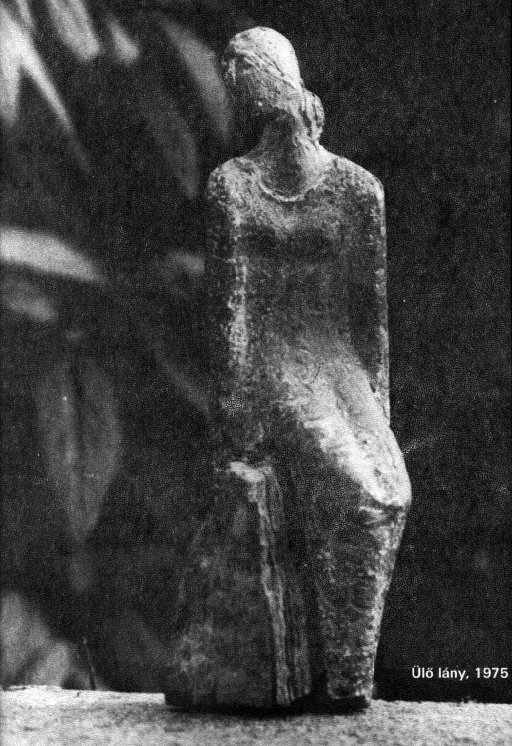
Ülő lány, 1975