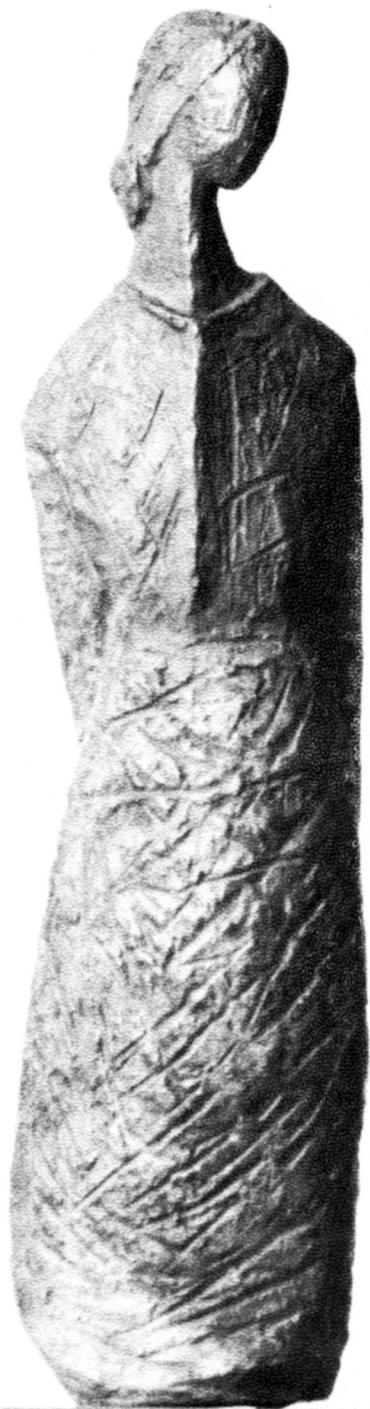
Női figura, 1975