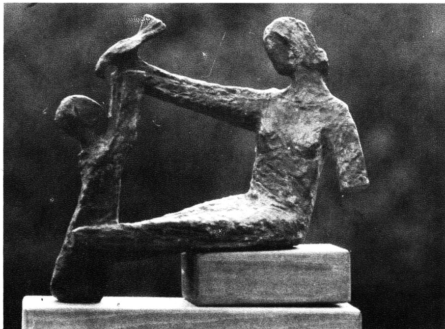
Teljes öröm, 1961