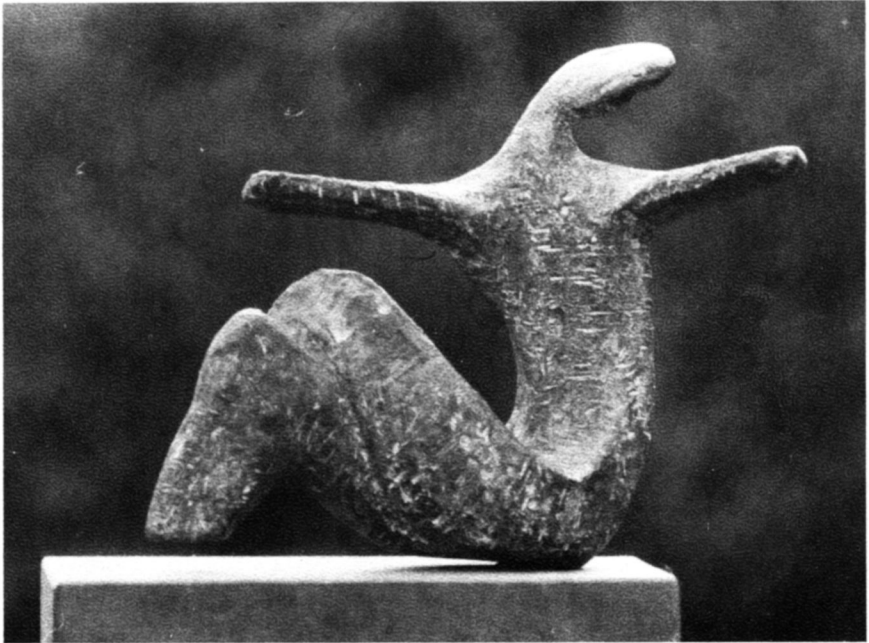
Két világ, 1961