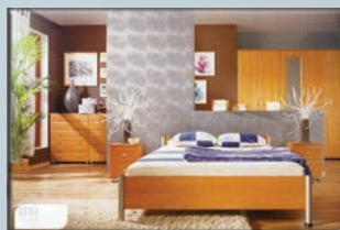
UNIF system elemes bútor

Akár 0% befizetéssel! Amennyiben a hitel összege eléri a 100 000 Ft-ot, a kezelési költség 0 Ft.