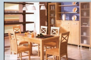
CLASSIC system elemes bútor