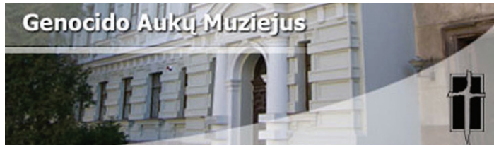
A „vilnisi Andrassy út 60.”

A hírhedt KGB-ház ma A Népiért Áldozatainak múzeuma