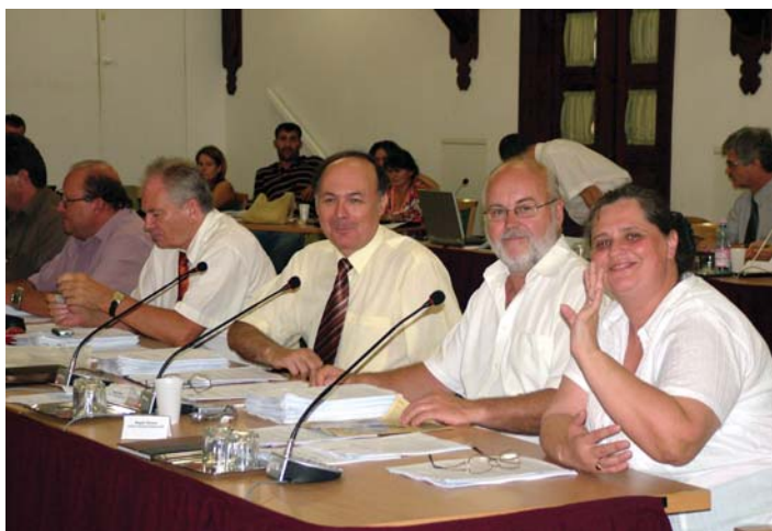
... mások mosolyogva fogadták.

A költségvetés módosításánál szintén vitát váltott ki a polgármes-