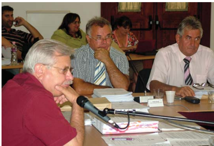
Együtt a Kanizsáért-frakció. Szívügyüknek tekintették az átültetést...

A minősített többség megvolt, ám így is huszonöt perces késéssel kezdte el munkáját a nyári szünet utáni első, szeptember 3-ára összehívott közgyűlés. Ezúttal azonban nem mindenki találta meg a helyét.