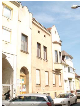
Kinizsi u. 2/a.

Az új utakat kereső fiatal építészek megelégtették az unalomig üzött timpanonos szemöldökkpárkányokkal, lizénákkal, stukkó- és