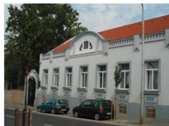
Kisfaludy Sándor u. 19/a.

vakolatdíszekkel agyondíszített homlokzatokat és a racionalitás jegyében megpróbálták ezeket mellőzni. (Mai szemmel persze másként látjuk e régi házakat is.) Nagykanizsán a jelek szerint éppen száz éve jelentek meg az első „modern” épületek, ami vidéki viszonylatban forradalmi újításnak számított. Különös szerencse,