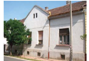
Kiály u. 9.

A Csengery utca 27/a alatti volt Fischel-ház eredeti tervrajzait a Thury György Városi Múzeum őrzi. A tervek és a megvalósult épület között azonban akadnak kisebb eltérések, a terveken még vakolatdíszek is szerepelnek, amelyek aztán a korabeli fotók szerint nem kerültek kivitelezésre. Az épület