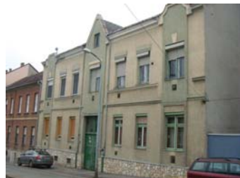
Kisfaludy Sándor u. 17/c.

virágzott, mely Nagykanizsa egész városközpontjának megjelenését máig ható módon meghatározta. Az 1890-es években jelent meg a szecesszió az építészetben, ami néhány kanizsai házban is felbukkan. A szecesszió azonban csak az egyik irányvonal volt az új utak keresésének, szinte vele párhuzamosan buk-