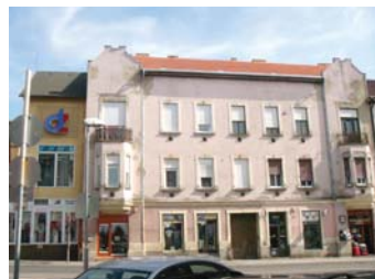
Király u. 34.

E házak értékeléséhez tudni kell, hogy a XIX-XX. század fordulóján még az eklektikus stílus