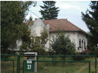
Szabadhegyi u. 37.

Ezen épületek homlokzatkezelésében az alábbi, részben a szecesszióra is jellemző vonások ismerhetők fel (természetesen nem mindegyiken): díszítés-mentes és egy-két esetben aszimmetrikus elrendezésű homlokzat, magas attikafal, finoman tagolt párkány, egy-két homlokzati rizalit hullámvonalú vagy háromszögű felmagasított oromfallal, egyszerű vonal-