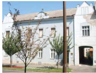
Fő út 21.

kantak fel a modernizmus csírái is a képzőművészetben és az építészetben. A robbanásszerűen ter-