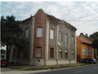
Sugár u. 55.

vezetésű és vakolat-keretezés nélküli nyílászárók, visszafogott színezés (szürkés alapszín és legfeljebb egy kiegészítő szín alkalmazása), szürke palatető, több épületen prizmaszerűen kiképzett zárt erkélyek. Fenti épületek beható tanulmányozása még további felismerésekhez is vezethet.