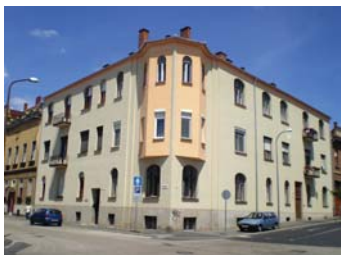
Csengery u. 27/a.