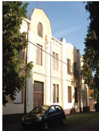
Csány László u. 8.

írtak róluk az újságok. Továbbá akkoriban minden jelentősebb építészeti tervet engedélyezés előtt egy szakértő bizottság véleményezett. Lényegesebb azonban, hogy a szóban forgó Csen-