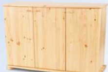
Anikó 3 ajtós komód: 44.200 Ft