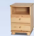
2 fiókos éjjeliszekrény: 14.800 Ft

Fenyő bútorok 5 év garanciával 20-30-40% kedvezménnyel