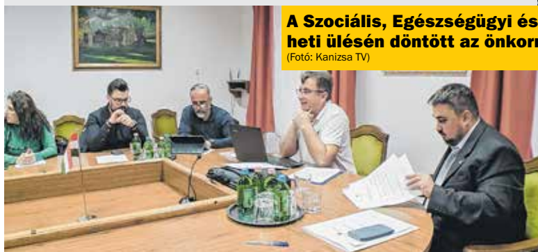
A Szociális, Egészségügyi és Környezetvédelmi Bizottság múlt heti ülésén döntött az önkormányzati bérlakásokról