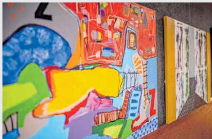
A Kőrösi-iskola galériájában a GébArt Zalaegerszegi Nemzetközi Művésztelepen készült alkotásokból nyílt tárlat