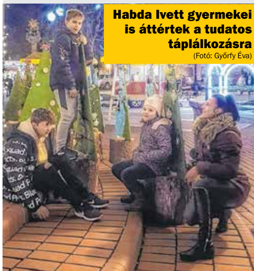
Habda Ivett gyermekei is áttértek a tudatos táplálkozásra