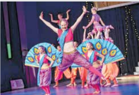
„Ütős” gyakorlatokat mutattak be a Szan-Dia FSC tagjai