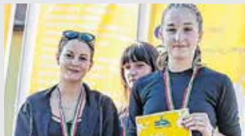
A duatlon diákolimpia döntőjében a Batthyány női csapatának bronzérem is jutott Marcaliban

Fennállásának harmincadik évfordulóját ünnepli a Szan-Dia Fitness Sport Club, amely természetesen idén is megszervezi Fitness Fesztiválját. A 2019-es a