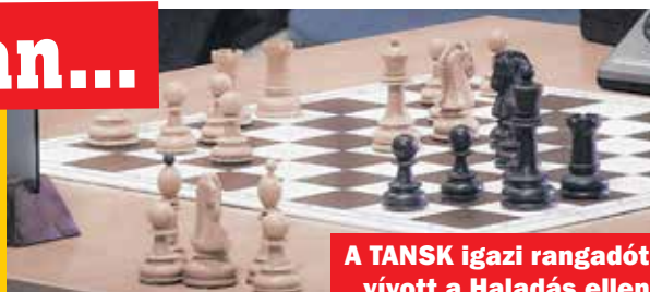
A TANSK igazi rangadót vívott a Haladás ellen