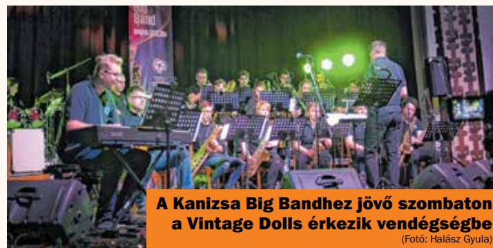
A Kanizsa Big Bandhez jövő szombaton a Vintage Dolls érkezik vendégségbe

December 20. (péntek) 19 óra Filharmonia – Fortissimo bérlet NEMZETI ÉNEKKAR KONCERTJE Előadók: Nemzeti Énekkar, Szalai Ágnes, Kristófi Ágnes, Korbász Viktor – ének, Bizjak Dóra, Zentai Károly – zongora. Vezényel: Somos Csaba. Belépődíj: 3400 Ft.