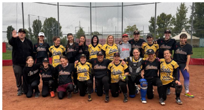
Csapatkép, a jellegzetes sportági mezekkel, ez is a Röntgen Kanizsa Ants softball együttese

Egy biztos, az itthon „mini” sportágként elkönyvelt softball is – a baseballhoz hasonlóan – nem kevés bajnoki címet, kupagyőzelmet, válogatott meccseket hozott a dél-zalai városba, s ne feledkezzünk meg jó néhány Európa-bajnokságról, melyekre a magyar válogatott az adott időben és helyzetben számtalan nagykanizsai játékost delegálhatott, s mindezek csúcspontja alighanem egy 2007-es zágrábi kontinensviadal volt, hiszen ide,