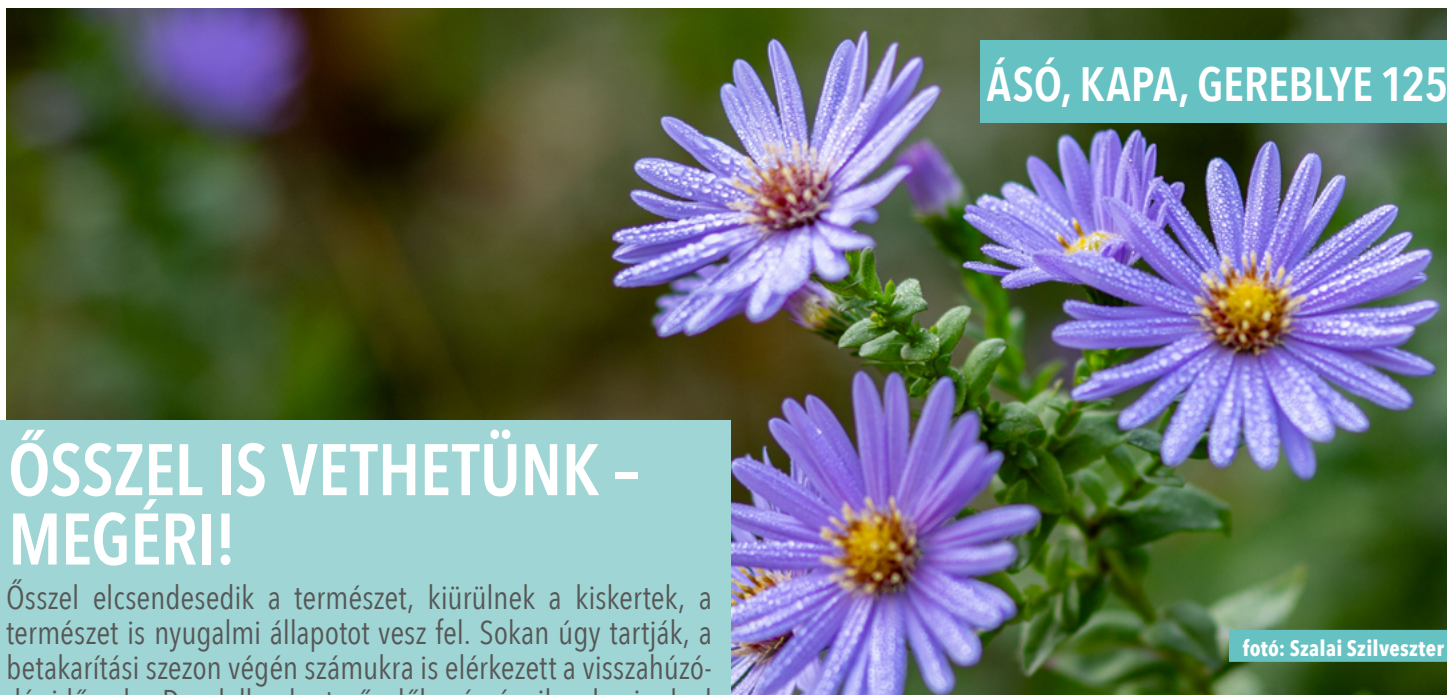
ÁSÓ, KAPA, GEREBLYE 125.