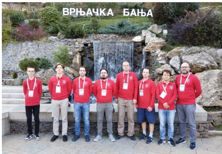
A képen a Tuxera Aquaprofit Nagykanizsai Sakk Klub Szerbiában szereplő csapata

A szerbiai Vrnjacska Banja egész héten tart a 39. Európai Sakk Klubok Kupája, melyen a 16-szoros magyar bajnok, a Tuxera Aquaprofit NSK együttese is résztvevő, mi több, az első fordulóban belga, majd a másodikban angol ellenfelét múlta felül biztosan.